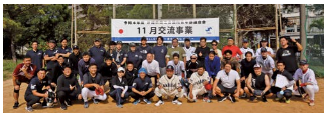
沖縄県商工会議所青年部連合会 集合

この日のドレスコードには『スポーッ に適した動きやすい服装』と案内されて いて、参加メンバーは思い思いのスタイ ルで参加していましたが、那覇YEGの 公式野球ユニフォームで参加しているメ ンバーも居て『この日を楽しむ』とい う気概を感じました。