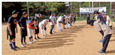
ソフトボールによる交流会