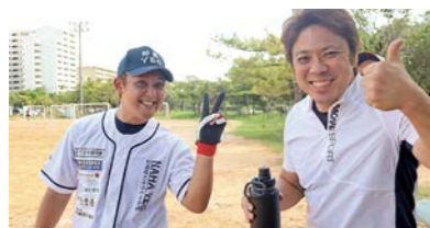
楽しそうな那覇YEG会員