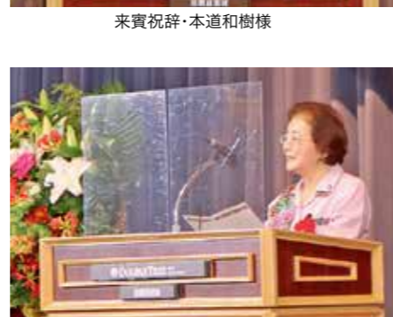
来賓祝辞・本道と樹様