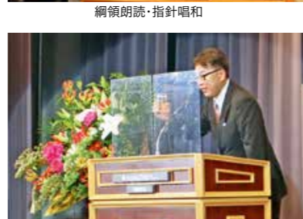
綱領朗読・指針唱和