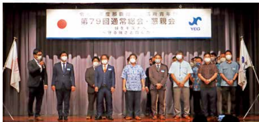
令和4年度理事紹介