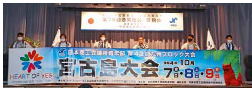
宮古島YEGキャラバン