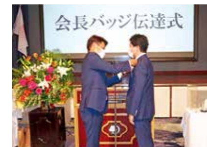
会長バッジ伝達式