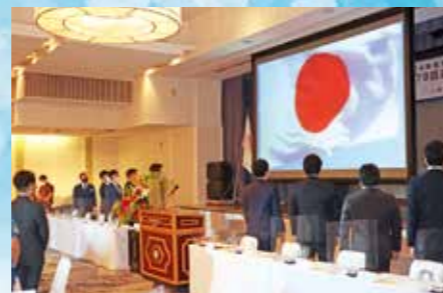
「伸び行く大地」斉唱