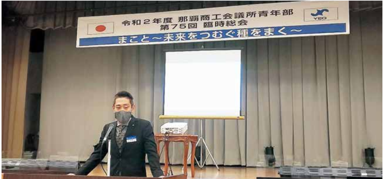
員頭の挨拶をする大城会長