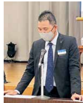
仲原選挙管理委員長